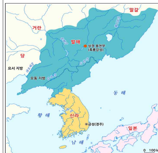
▲ 발해의 전성기(9세기)