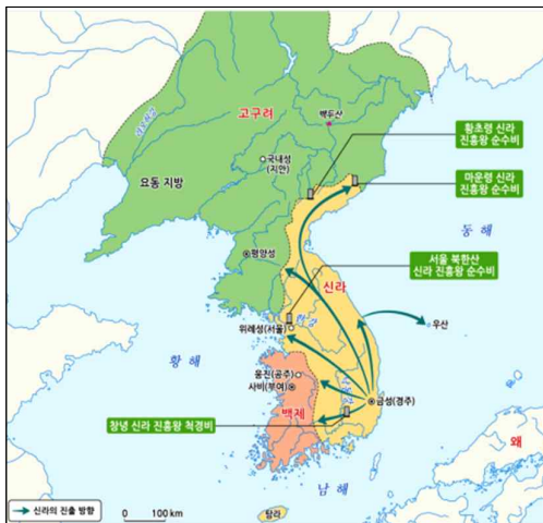
▲ 신라의 전성기(6세기)