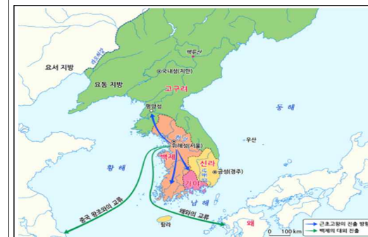
▲ 백제의 전성기(4세기)