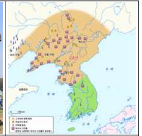
▲ 고조선의 문화 범위