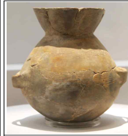
▲ ( 미송리식 ) 토기