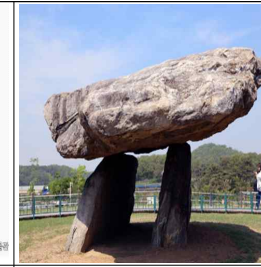
▲ 탁자식 ( 고인돌 )