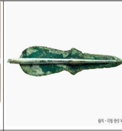
▲ ( 비파형 ) 동검