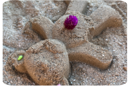
모래와 돌멩이 분리하여 놀이하기