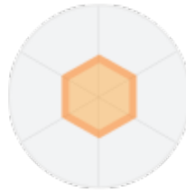
작은 정육각형 모양

왕성한 열정으로 많은 분야에 관심을 보이지만 좀 더 소질이 있는 분야에 대한 선택과 집중도 필요합니다.