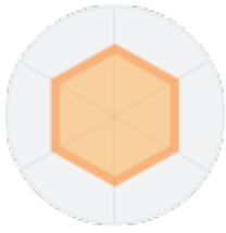
큰 정육각형 모양

흥미유형 육각형 모형은 그 모양과 크기에 따라서 다음과 같이 해석할 수 있습니다.