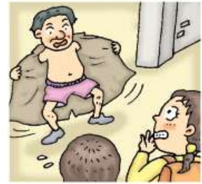
아무것도 보지 않은 것처럼 침착하게 그대로 지나친 후, 학교나 경찰서에 신고하기