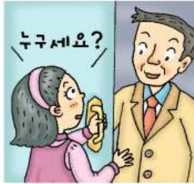
문을 먼저 열어 주지 않기