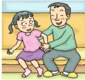
단둘이 있지 않도록 그 장소에서 나오기