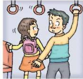
"왜 이러세요? 하지 마세요."라고 큰 소리로 주변 사람에게 알리기