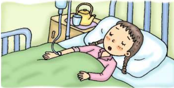
정말 성폭행을 당했다면, 그 당시의 속옷을 찢지 말고 그대로 보관한 채 병원으로 가서 진찰을 받아야 합니다.

기분이 나쁘고 싫을 때에는 상대방의 눈을 똑바로 쳐다보며 "안돼요, 싫어요."라고 큰 소리로 똑똑하게 말합니다.