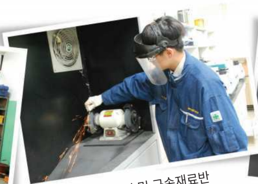
열처리 및 금속재료반