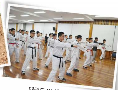
태권도 및 체력인증 활동