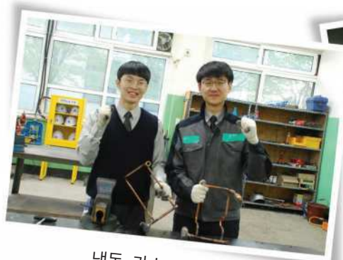
냉동, 가스, 신재생반