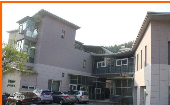
<강의실 전면 사진>