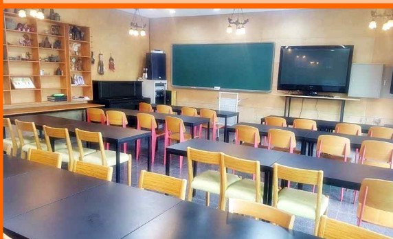
<대 강의실 사진>