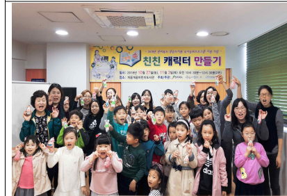
책속에 있는 캐릭터를 만들어봐