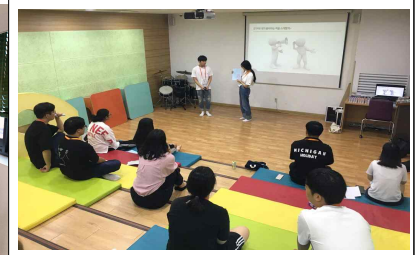
청소년 동아리 활동