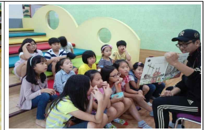
고등학교 오빠와 함께하는 독서교실