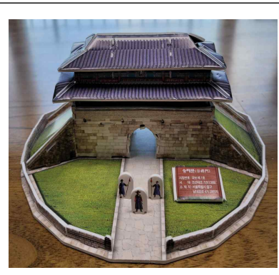
역사 교구를 이용한 만들기 활동