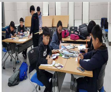
모둠별 조사 발표 활동