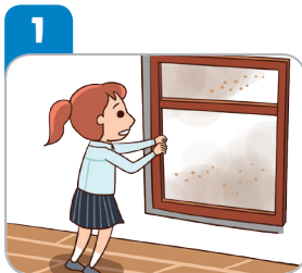
창문을 닫고 장시간 실외활동을 자제한다.