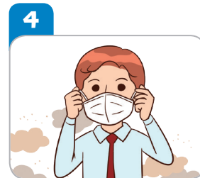
외출 시 마스크를 착용한다.