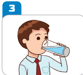
충분한 수분을 섭취한다.