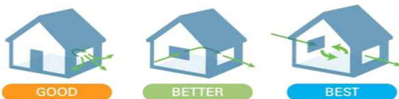
[자연환기 방식별 환기효과 비교]