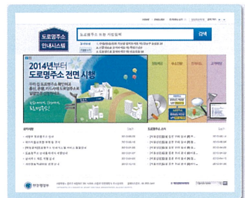
〈 도로명주소 홈페이지 www.juso.go.kr 〉

» 포털사이트에서! • 인터넷 검색 창에 지번주소를 입력하면 도로명주소를 쉽게 확인할 수 있습니다.