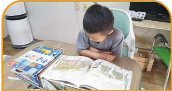
교과서 독서 (한글 깨치기)