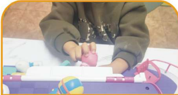
영역별 검사 및 치료