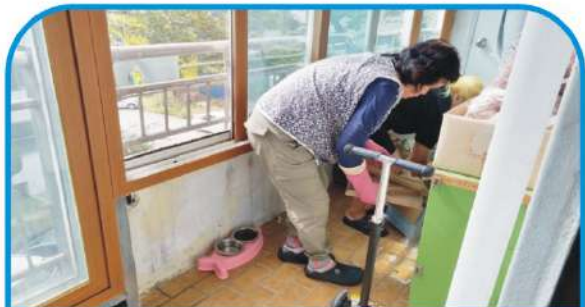
청소 및 방역