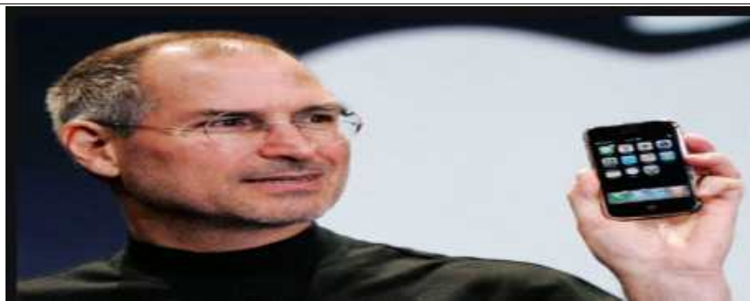
스마트폰의 아버지 스티브 잡스도 자녀들은 스마트폰 사용에는 엄격했다.

최대한 늦게! 적어도 초등학교 졸업 후에 사주어야 한다. 학생의 정서적, 인지적 발달에 도움이 되지 않는다.