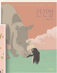
긴긴밤 루리, 문학동네, 2021