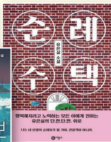
순례주택 유은실, 비룡소, 2021