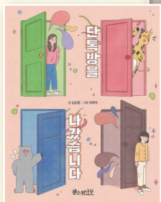
단독방을 나갔습니다 신은영, 소원나무, 2022