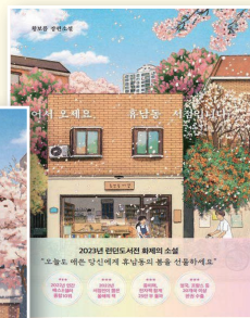
어서오세요, 휴남동 서점입니다. 황보름, 클레이하우스, 2022