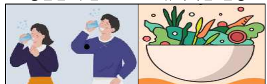
충분한 수분 섭취