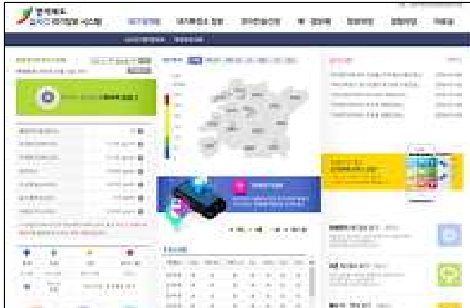
홈페이지( http://jihe.jeonbuk.go.kr )