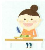
올바른 영양 및 식생활 관리 방법