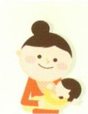
모유수유, 이유식 진행 방법