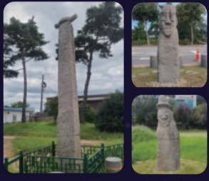
[국기민속문화재] 동문안 당산