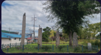
[국기민속문화재] 서문안 당산