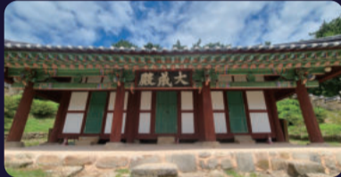
[문화재자료] 부안향교 대성전