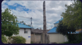
[전라북도 유형문화재] 서외리 당간