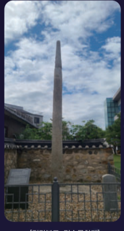
[전라북도 민속문화재] 남문안 당산