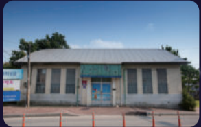
[국기등록문화재] 구 부안금융조합