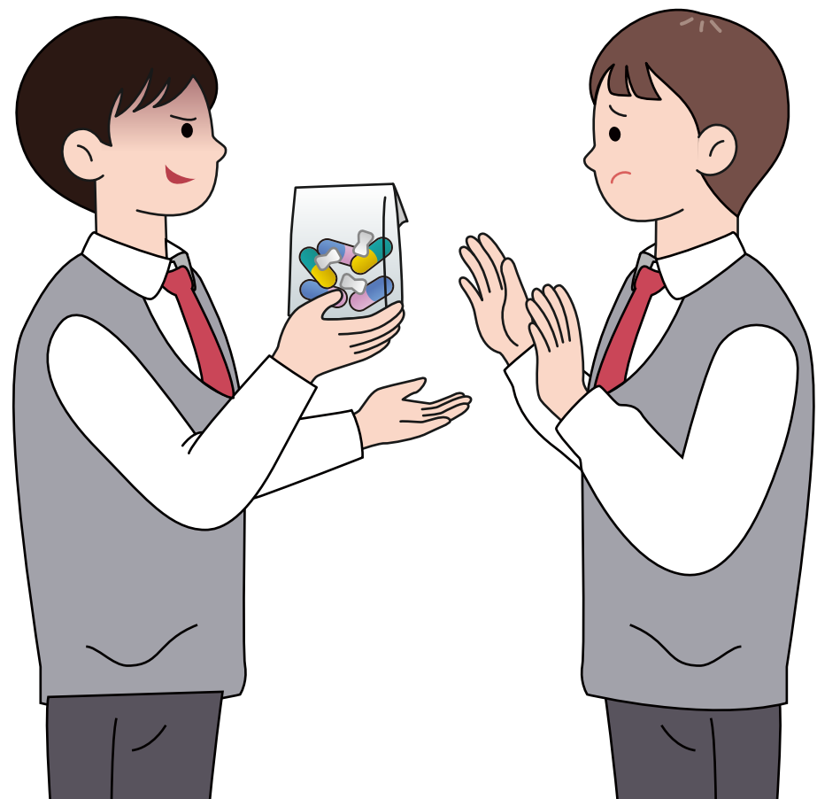
마약류 범죄 연루