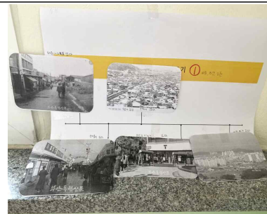
[개념 인식 수업 활동 결과물 3]