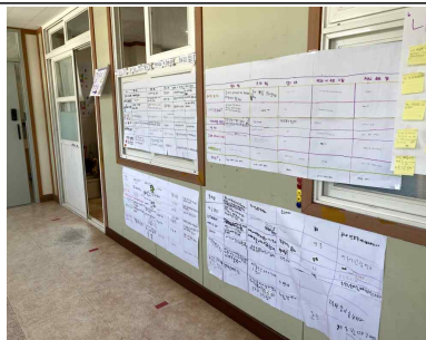
[개념 인식 수업 활동 결과물 2]