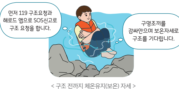
< 구조 전까지 체온유지(보온) 자세 >