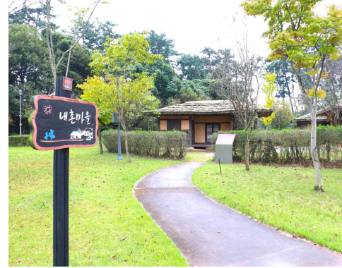
내촌 · 외리마을