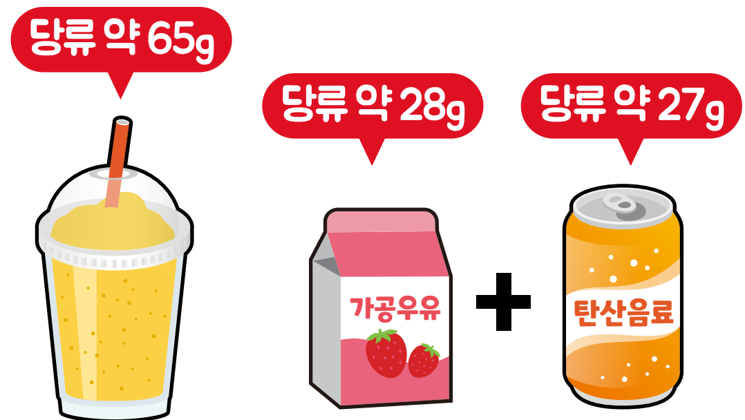
WHO 1일 당류 섭취 권고기준 초과!