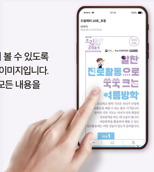
모바일에 최적화된 이미지 ▶

웹이나 모바일에서 스크롤바를 오르내리면서 볼 수 있도록 기존 드림레터의 폭과 배치를 재구성한 세로 이미지입니다. 글자를 확대하거나 옆으로 이동하지 않아도 모든 내용을 볼 수 있다는 장점이 있습니다.