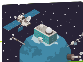
기상·재난 관측 분야

기상·재난 관측 분야는 태양이 내뿜는 우주전파를 분석해 일상생활에 미치는 영향을 분석하는 일도 우주 기술의 응용이에요. 위성을 활용한 재난 관리 시스템에도 기술이 활용되고 있어요.