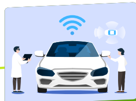
미래 자동차 분야

자율주행을 중심으로 하는 미래 자동차 산업도 무인 우주 탐사 기술에 영향을 받아요. 제조, 미래 연료, 미래 자동차 기술정비 등 산업 전반이 연관돼 있어요.