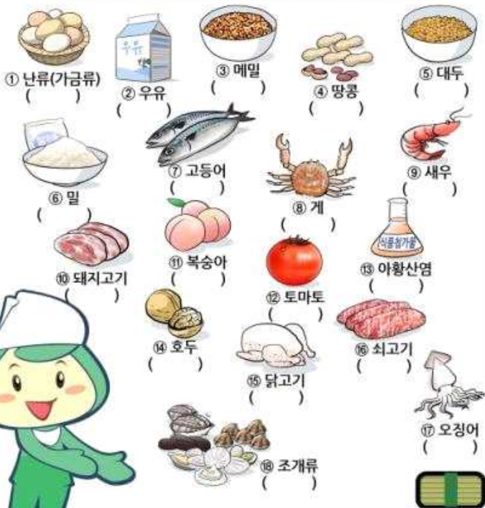
<알레르기 유발식품 표시제>

식품에 의한 알레르기가 있는 학생은 식단표에서 알레르기 유발식품을 확인하세요