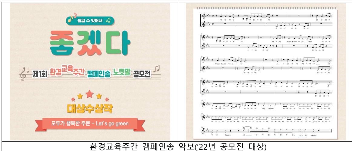
환경교육주간 캠페인송 악보(22년 공모전 대상)

** '22년 공모전을 통해 제작된 탄소중립과 친환경 실천 의지가 담긴 환경교육주간 음원