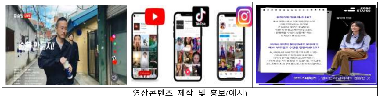
영상콘텐츠 제작 및 홍보(예시)