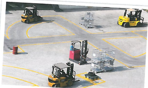
2019학년도부터 교육예정인 건설기계조종면허 자격과정