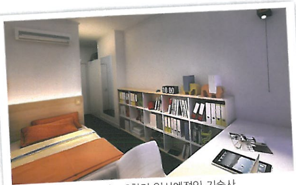
2019학년도 2학기 입사예정인 기숙사

토목측량, 토목건축설계를 바탕으로 드론관련 기초 실무교육을 배울 수 있습니다.