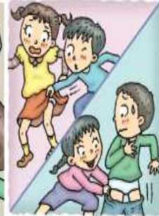
치마나 바지 벗기기