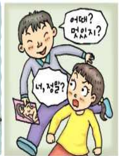
아한 시선 보여주기