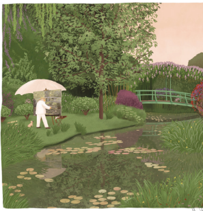
화가의 작업실 - 프리다 칼로 2021, Giclee print on archival paper, 50.8 X 50.8 cm