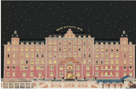
그랜드 부다페스트 호텔 2015, Giclee print on archival paper, 122 X 91.5 cm