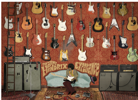
지미 헨드릭스 익스피리언스 2014, Giclee print on archival paper, 128 X 92.5 cm