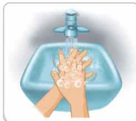
2 손바닥을 마주하고 깍지 끼어서 닦는다