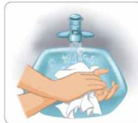
7 종이타월로 물기를 닦는다