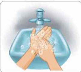
5 손톱을 세워 다른 손바닥에 마찰하듯이 닦는다