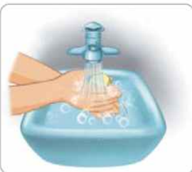
1 흐르는 물에 손을 적시고 비누를 바른다