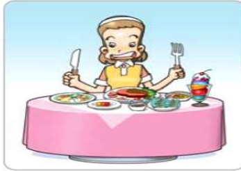
음식 먹기 전