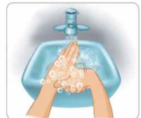
4 손가락을 돌려 닦는다