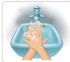
3 손바닥으로 다른 손의 손등을 닦는다