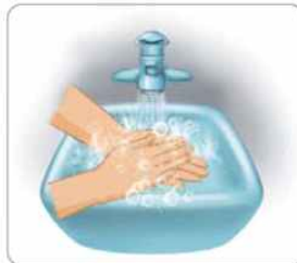
6 흐르는 물에 비누거품을 제거한다