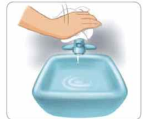
8 종이타월로 수도꼭지를 잠근다