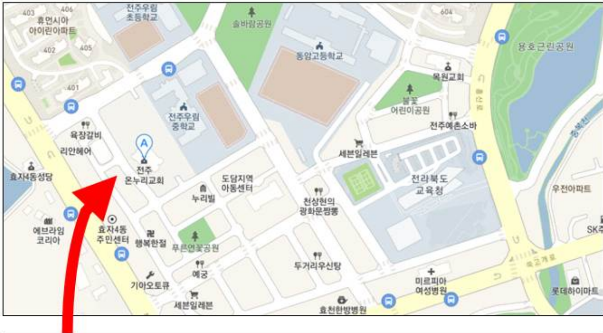
전주 온누리교회 주차장